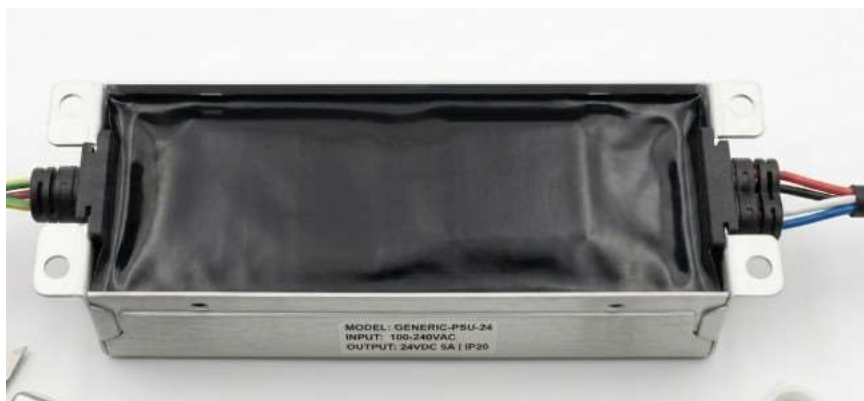
LED Driver AI 生成示意圖