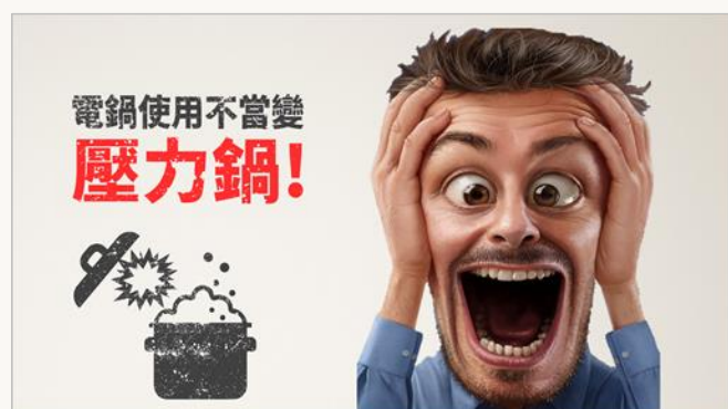
電鍋使用不當變成壓力鍋