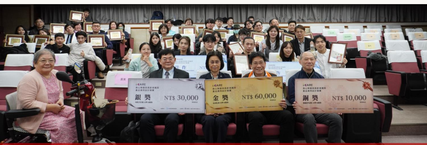
鼓勵輔具產品友善創新-標準局競賽評選結果出爐