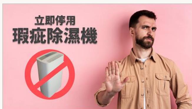
立即停用瑕疵除濕機