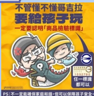
購買玩具請認明 商品檢驗標識