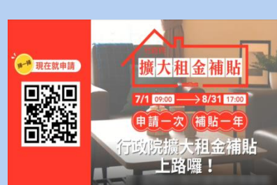
擴大租金補貼專案