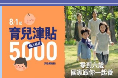
8/1起育兒津貼提高 為每月5000元!