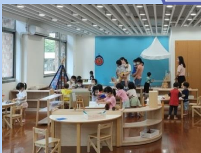
經濟部標準檢驗局職場互助 教保中心臺中分局8月開辦