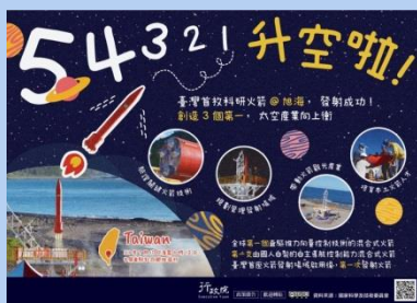
臺灣科研火箭研發成果