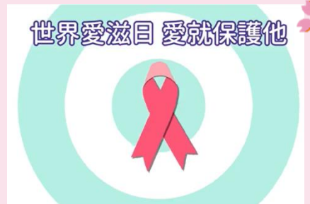
世界愛滋日 愛就保護他