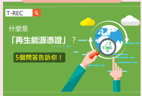
什麼是再生能源憑證