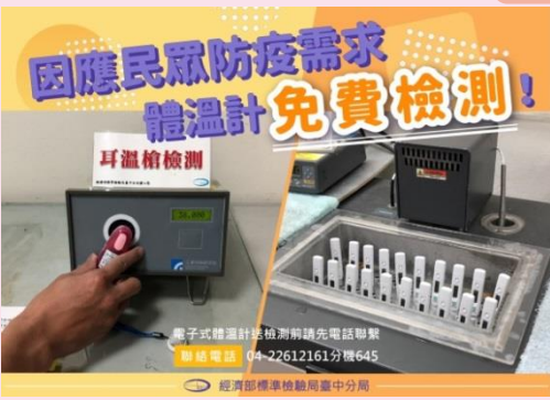
因應民眾防疫需求 體溫計免費檢測