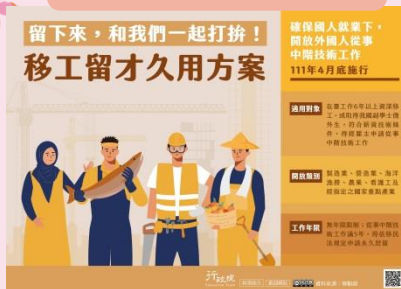
移工留才久用方案