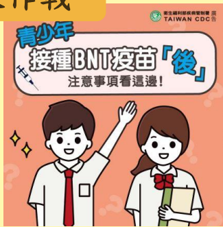
青少年接種BNT後 注意事項