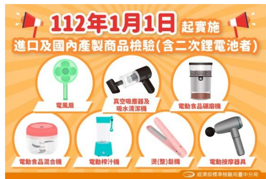
列檢範圍再升級，7項家用 電器(含使用二次鋰系電池) 商品公告納入檢驗