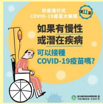
如果有慢性或潛在疾病 可以接種COVID-19疫苗嗎?