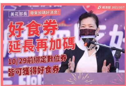
好食券延長再加碼