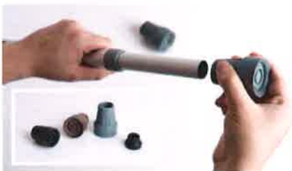
醫療用品店或百貨公司醫療用品部一般有不同尺寸的杖端膠墊配件售賣，宜攜帶手杖往選購尺寸合適的膠墊。

由於用者的使用習慣對杖端膠墊的磨耗程度有着直接的影響，故此即使是耐磨度較高的膠墊，用者亦應定期檢查膠墊的磨耗程度。若發現膠墊損耗嚴重、變形或溝痕變得不明顯時，應立即更換，免得膠墊失去防滑功能而產生危險。醫療用品店或百貨公司醫療用品部一般都有杖端膠墊配件售賣，消費者宜攜帶手杖到店鋪選購尺寸合適的杖端膠墊。此外，消費者亦可向有關代理商或分銷商查詢更換膠墊配件事宜。