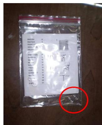
新增配件照片 (包含 1 組羅馬簾繩擋及安裝說