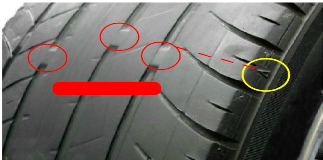
圖 3 輪胎溝紋已磨耗至指示平臺 (須更換新胎)