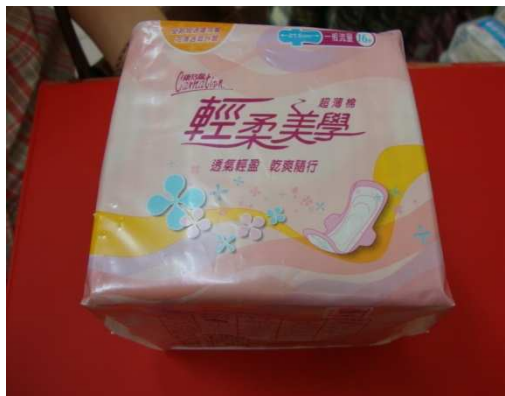
一般商品(鍋子)標示於 外包裝上