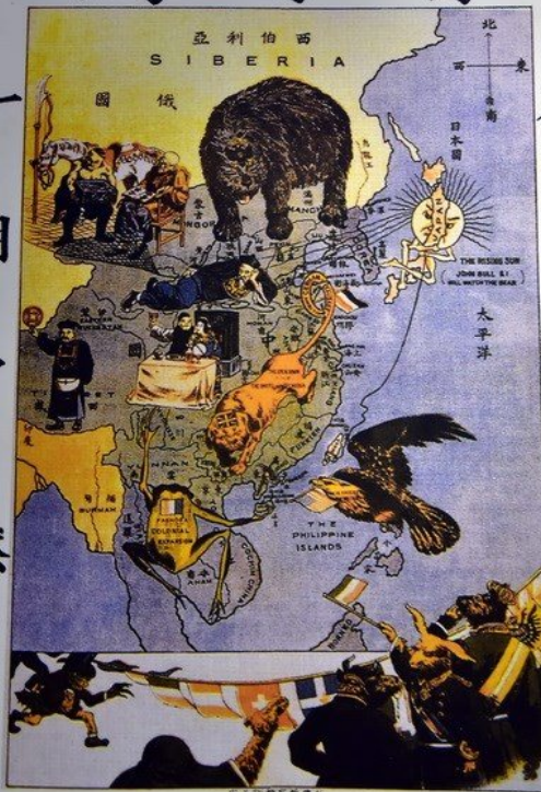
時局圖。19世紀末，列強掀起了瓜分中國的狂潮，中國面臨瓜分豆剖的嚴重危機。