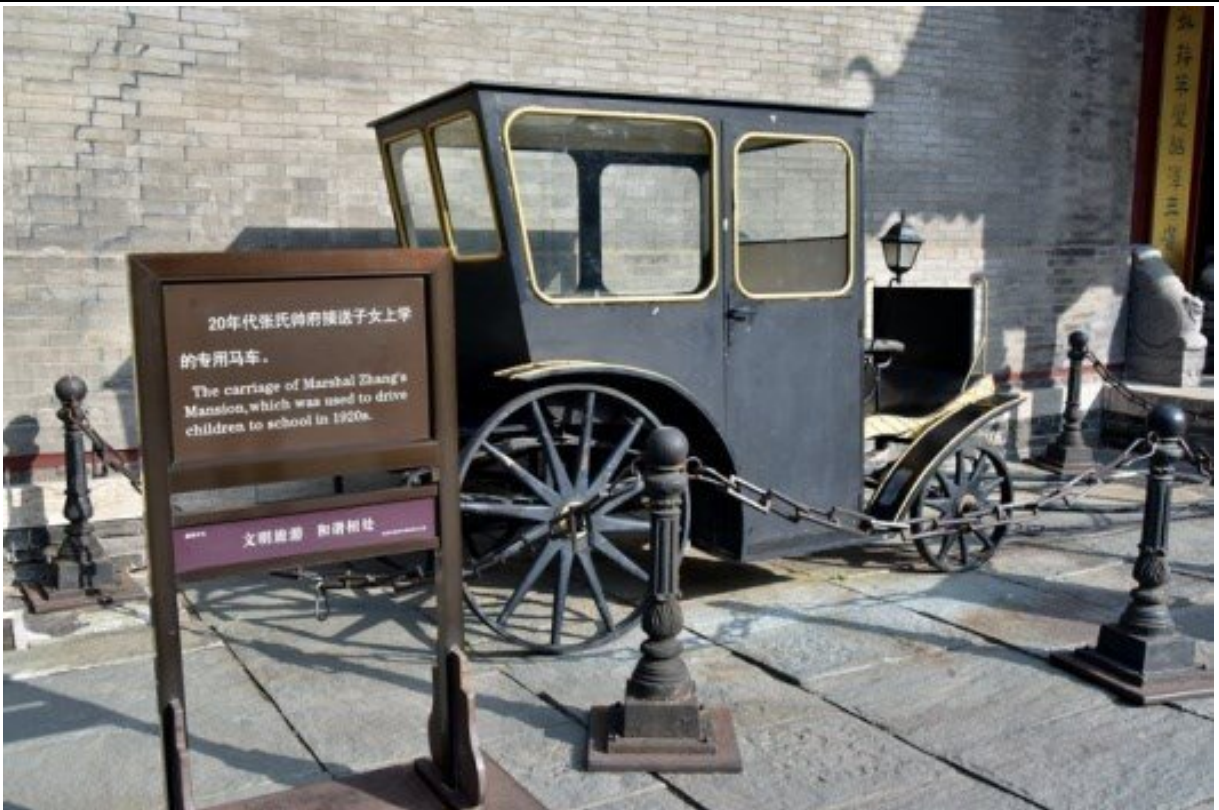
少帥府 20 年代載送子女上學之馬車