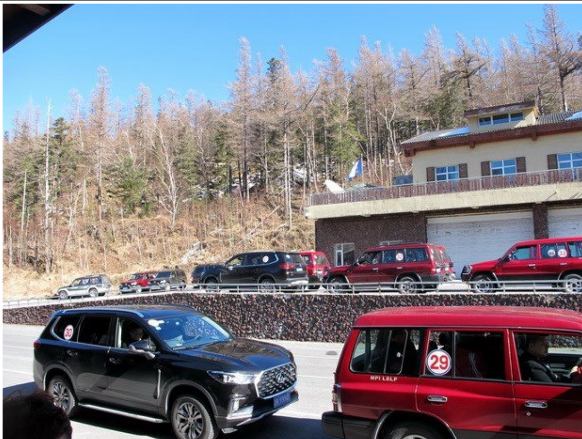
第三天中午到 長白山山腳，轉搭公園之越野車上山