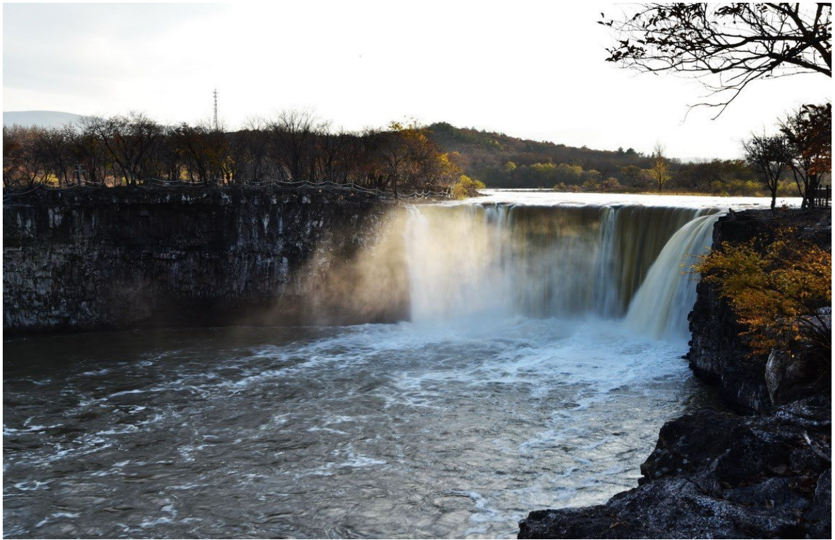
吊水樓瀑布---位於鏡泊湖北端，陽光下形成絢麗彩虹美景