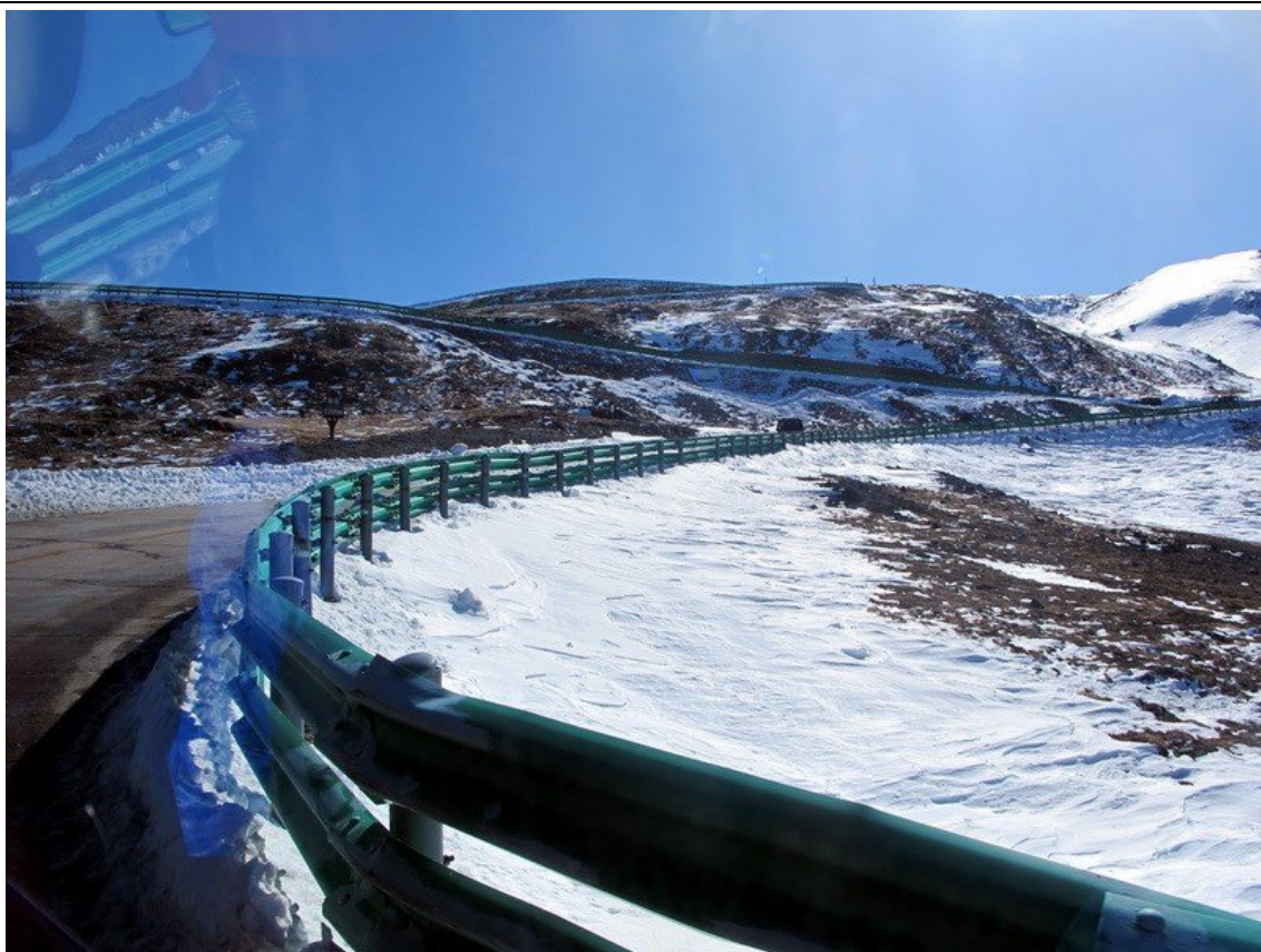
上山路面很平整，但上山全線是“之字形”道路上升