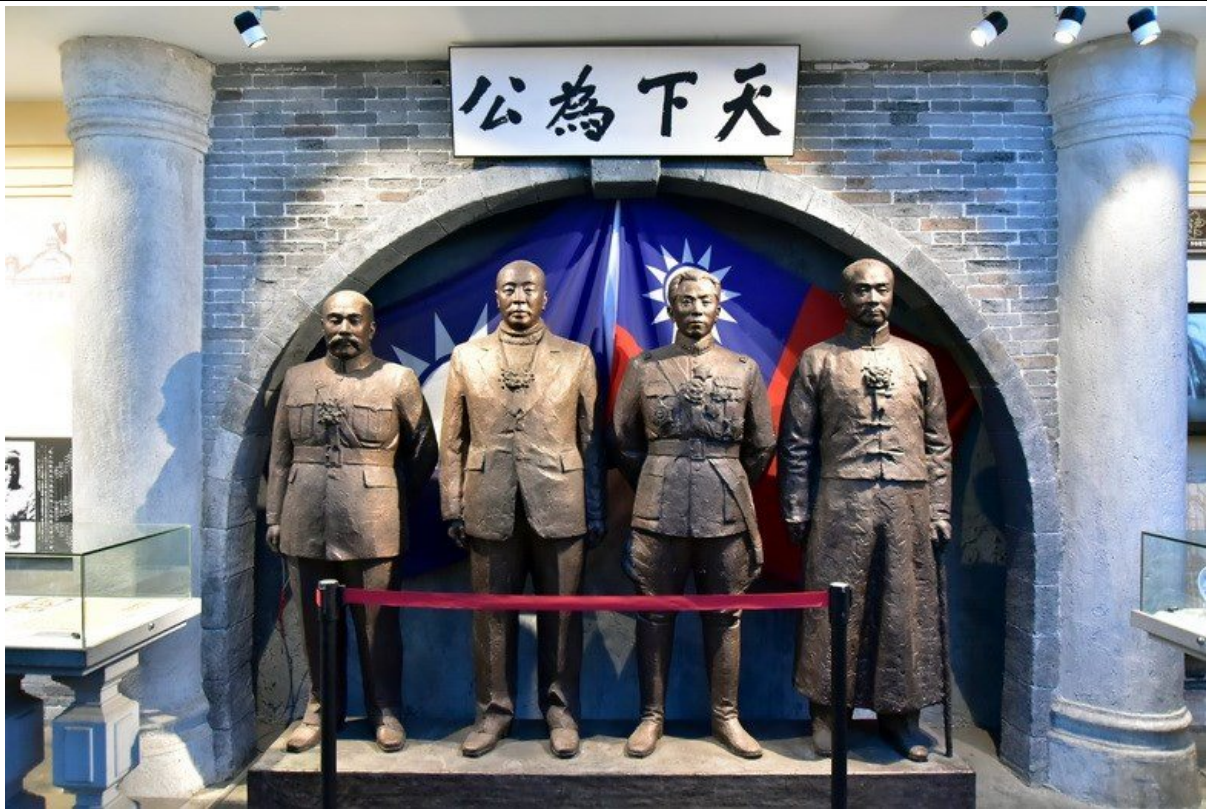
少帥府內：中華民國 國旗及黨旗