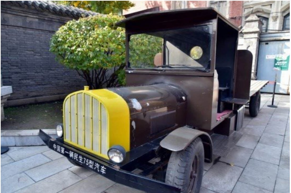
中國第一輛民生 75 型汽車