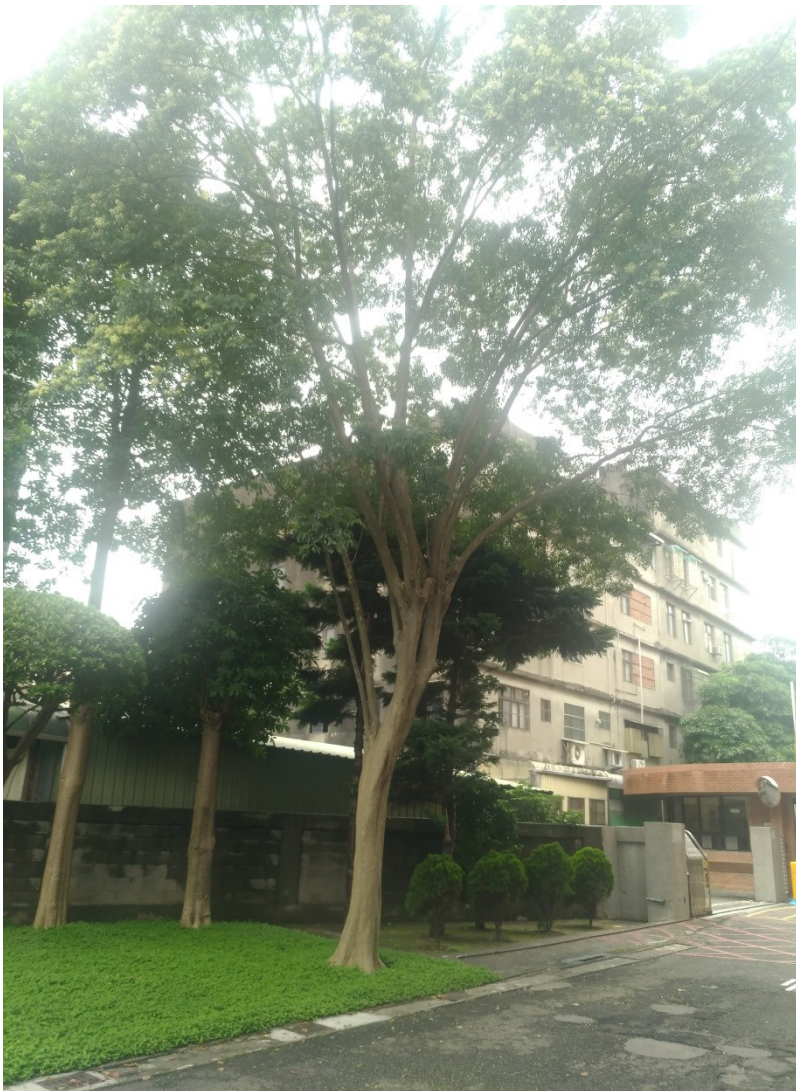
標準檢驗局新竹分局桃園辦事處大樓前的光蠟樹

光蠟樹是台灣的原生樹種，因材色白而且有油蠟的感覺，所以也被稱為「白雞油」或「台灣白蠟樹」，主要生長於台灣低海拔闊葉林中，由於樹形優美，也常常被栽植於庭園景觀樹或行道樹，也是重要原生造林樹種。光蠟樹開花時並不明顯，要一直等到成群的綠白色果實成熟後，才會吸引大家注意。假若用這樣描述您還是沒辦法分辨出什麼是光蠟樹，那麼，建議您來標準檢驗局新竹分局桃園辦事處走一遭。在民國 80 年標準檢驗局成立桃園辦事處時，就在大樓左前方種植一棵光蠟樹，到目前為止樹齡已近 28 年，枝葉繁密茂盛，儼然成為桃園辦事處的代表樹。只是樹木正值壯年，而人已漸趨老邁，讓人有不勝唏噓之感。