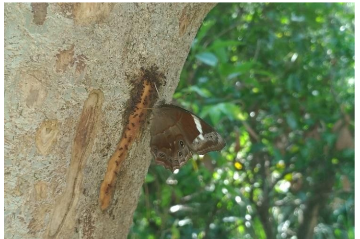
分享光蠟樹汁的類、蜂類與蟻類