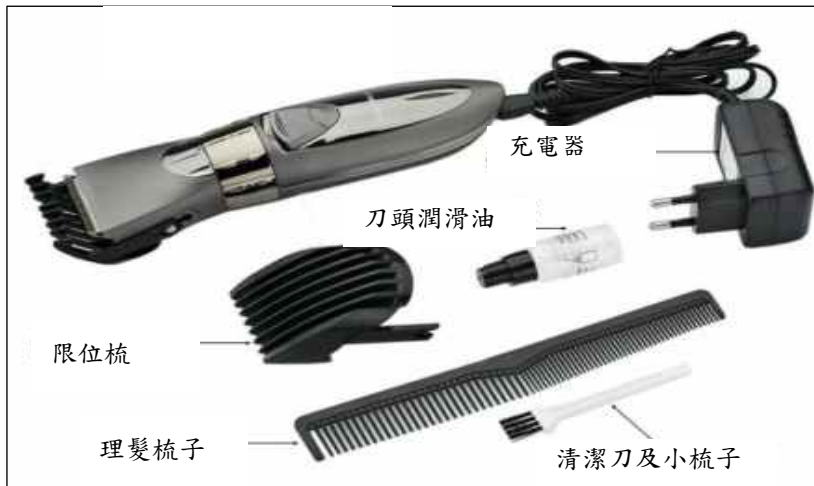
(a)電剪髮器組及套件