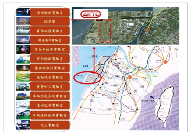
▲ 圖3. 車輛中心檢測能量

心也持續在縣境內積極推動政府計畫，爭取輔導資源，協助車輛零組件廠商獲得更好的發展，統計民國96年至98年，針對技術移轉、技術輔導、產品改良等輔導項目共計55案，受惠企業包括：摩特動力、帝寶工業、新傑燈光等32家廠商。除此之外，車輛中心亦大力推動業界合作，例如：成功促成縣內車燈大廠與國內電子大廠組成LED先進車燈AM量產開發聯盟，積極投入LED頭燈產品開發，率先為次世代LED頭燈產品量產做整合佈局、以及協助國內後視鏡製造大廠，整合ARTC所自主研發的安全警示系統、甚至電子收費系統廠商技術等，讓傳統後視鏡升級成為多功能性的智慧型後視鏡等。