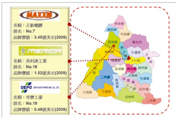
▲ 圖1. 彰化縣境內車輛相關國際知名品牌廠商位置

其中，在運輸工具部分特別是汽車零組件業表現方面尤其傑出。2009年，在台灣20大國際品牌排行榜裡，包含有四個車輛相關製造企業品牌入列，而其中就有三家品牌企業總部是位於彰化縣境內，分別爲從事國際輪胎製造大廠的正新工業、享譽全球的自行車製造廠的美利達工業，以及知名車燈製造的帝寶工業。光是這三家企業所創造出的品牌價值總計就高達5.46億美元(如圖1)。