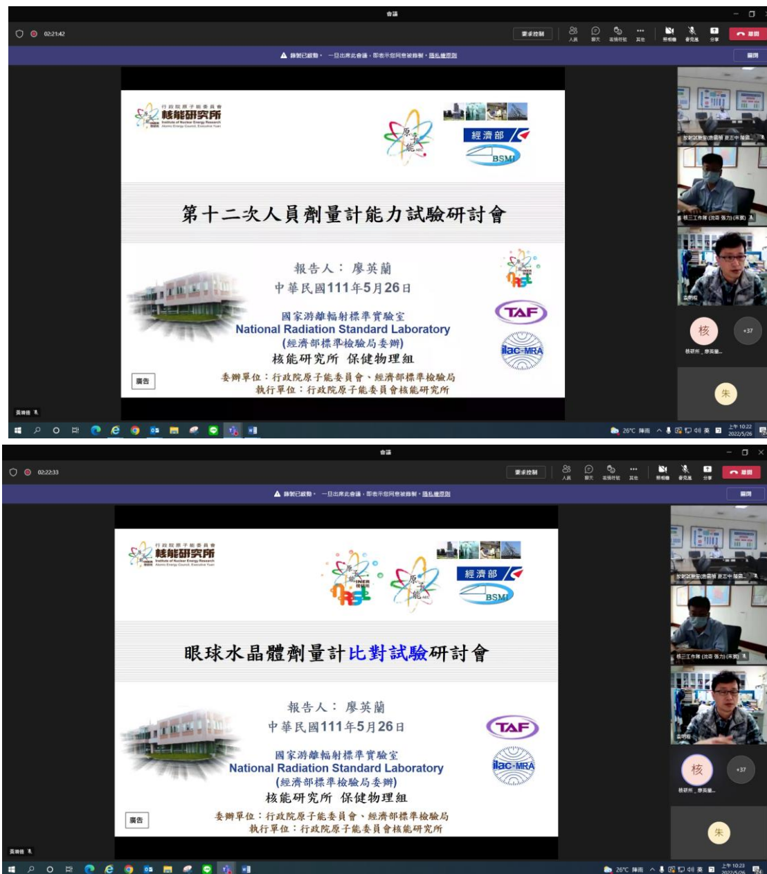
圖 3、「人員劑量計能力試驗執行前與眼球水晶體劑量計比對試驗研討會」擷取畫面