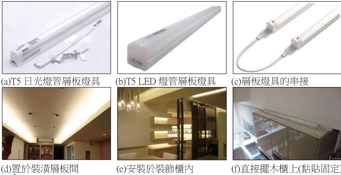
圖 3 層板燈具外觀、燈管光源種類、串接及安裝場所應用[1]~[6]