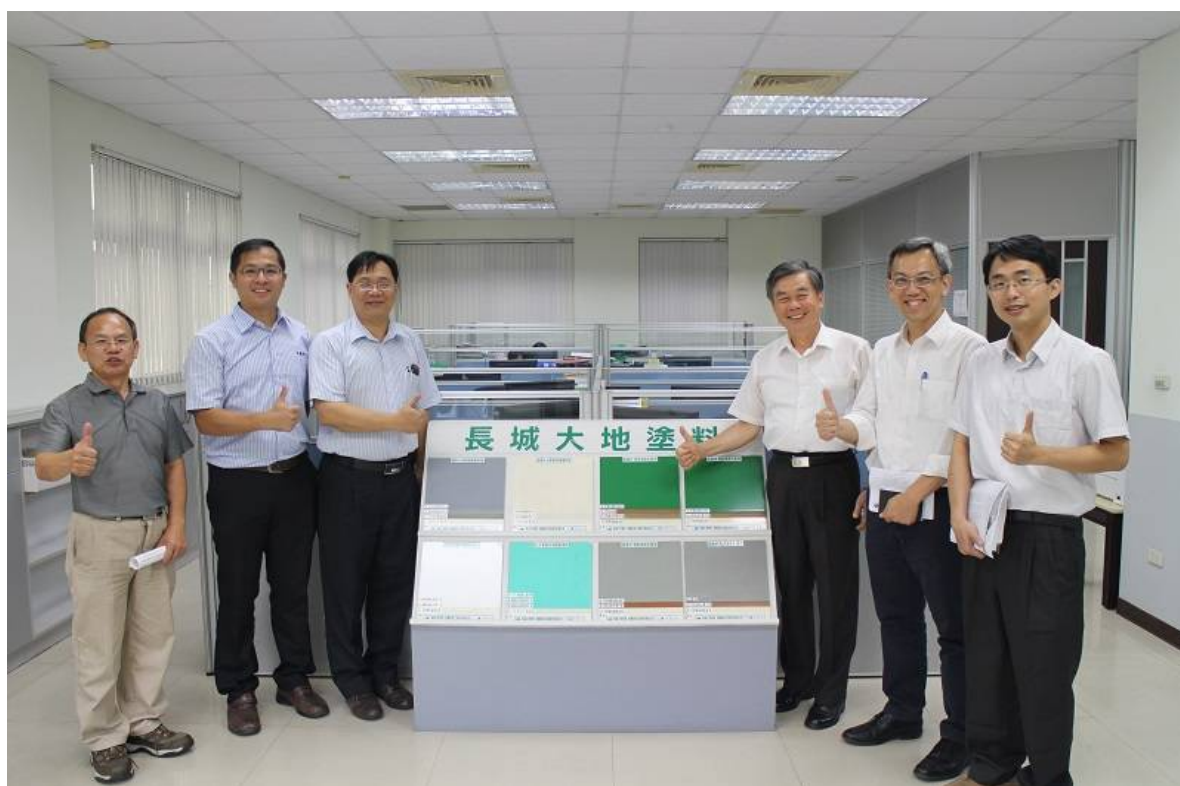
袁廠長（右3）、沈分局長（左3）及分局同仁合影