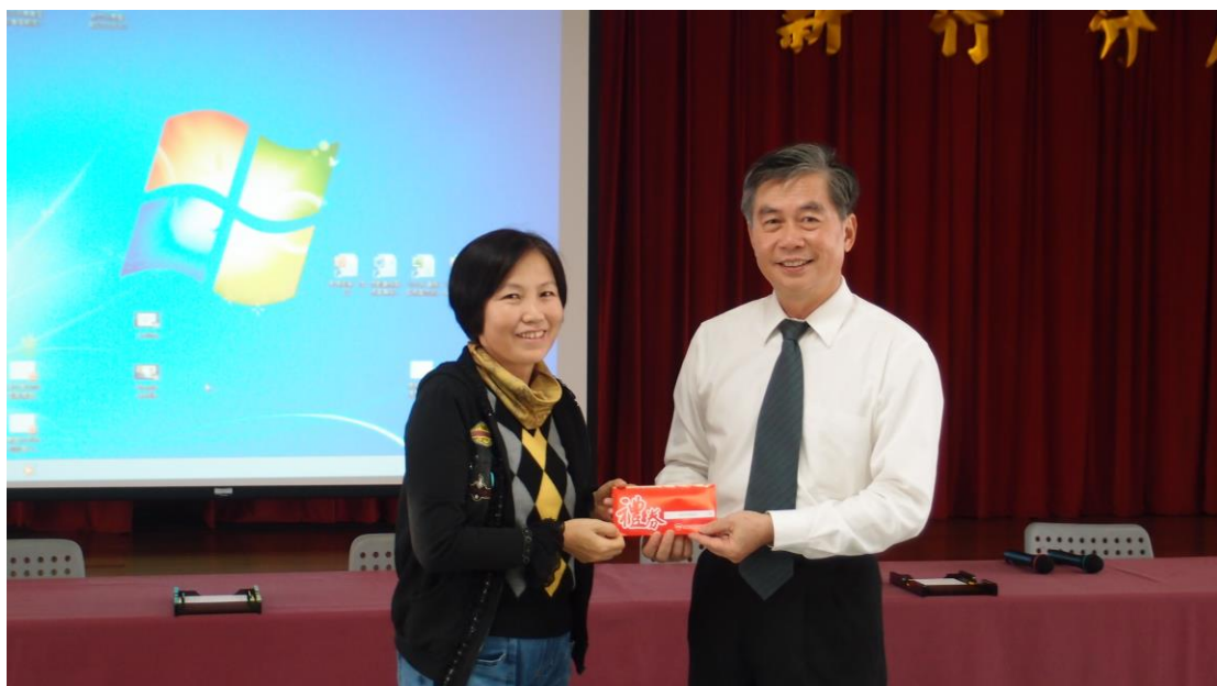
分局長(右)表揚績優義務監視員