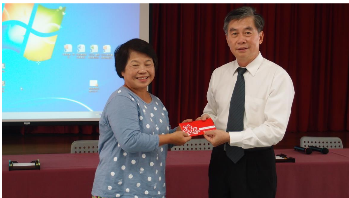
分局長(右)表揚績優義務監視員