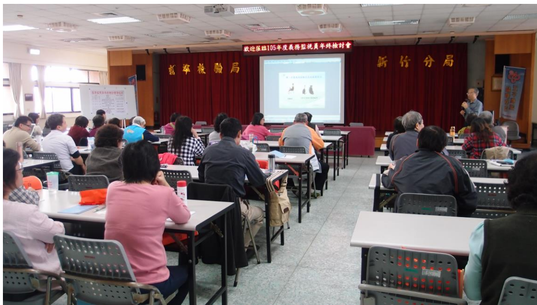
義務監視員反映案件成效與宣導說明課程