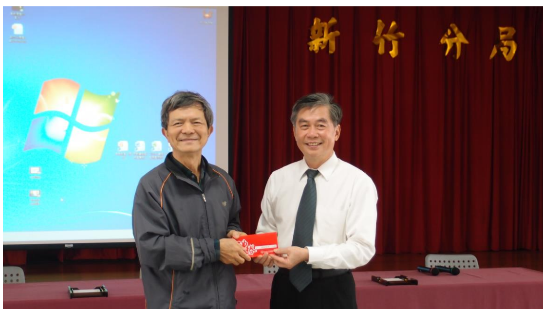
分局長(右)表揚績優義務監視員