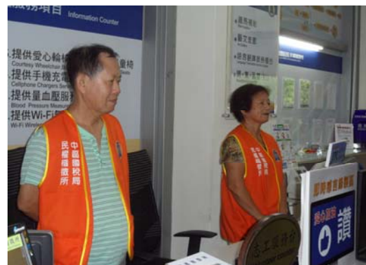
中區國稅局志工服務人員