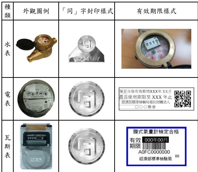
圖 2 家用三表「同」字封印及有效期限的樣式